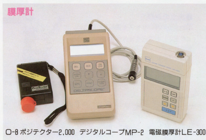
O-8 ポジテックター2,000 デジタルコープMP-2 電磁膜厚計LE-300