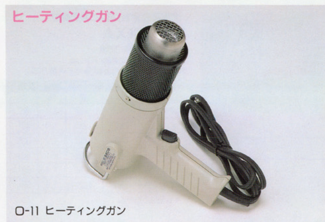
O-11 ヒーティングガン