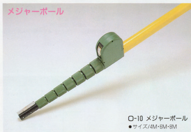
O-10 メジャーボール ●サイズ/4M・6M・8M